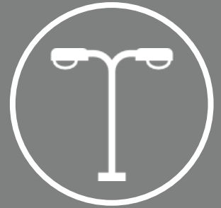
Proveedores de infraestructura pasiva